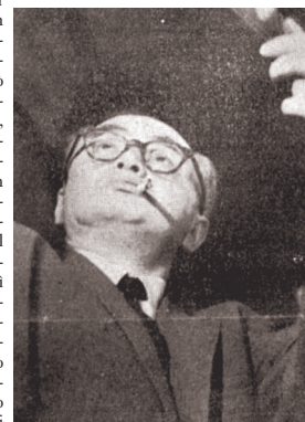
David Seymour, presidente della Magnum Photos fulminato dalla mitraglia a Porto Said.